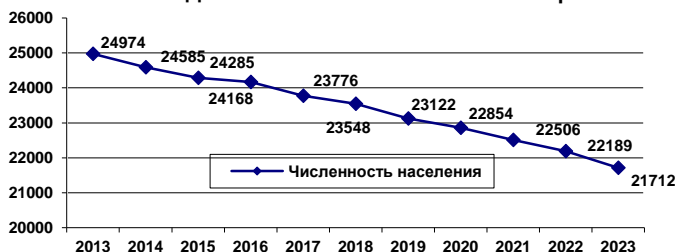
Динамика численности населения района

Миграционный оборот населения (сумма прибытий и выбытий) в 2023 году по Валдайскому району составил 1720 человек, в 2021 году – 1941 человек. Миграционная активность населения характеризуется следующими данными: