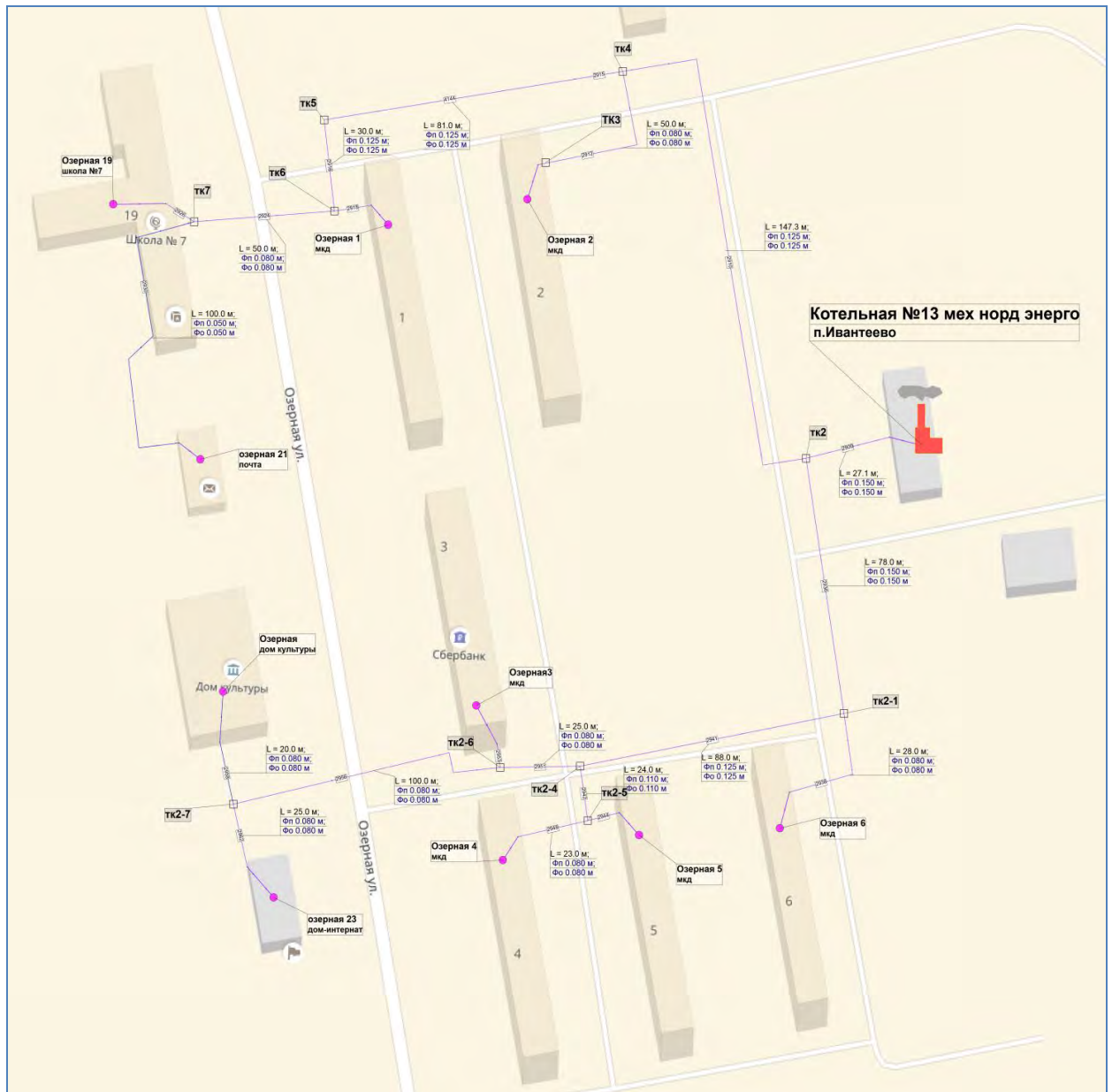
Рисунок 1. Схема тепловых сетей котельной № 13, п. Ивантеево