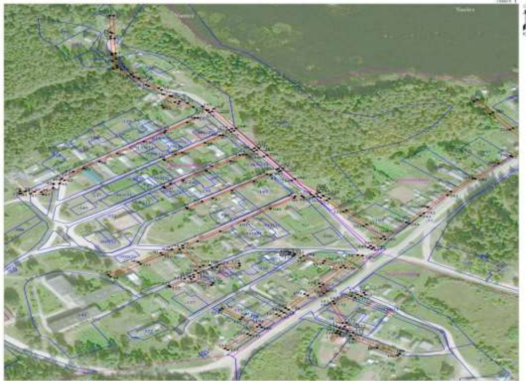
Схема границ размещения публичного сервитута Объект: "В.1-0,4 кв с. Едрово ул. Белова" (опишемывание объекта)